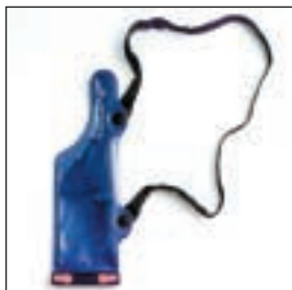
HLN9985 Futerał wodoszczelny