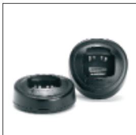
MDHTN3001/MDHTN3002 Ładowarka jednostanowiskowa Z wtyczką europejską / z wtyczką brytyjską