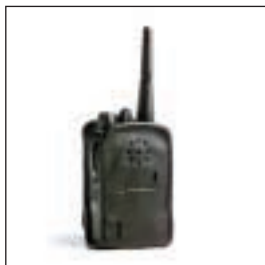
PMLN4521/PMLN4421 Lekki futerał skórzany z obrotowym zaczepem do paska