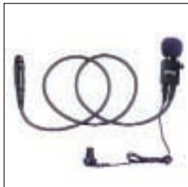
MDJMMN4062 Zestaw kamuflowany