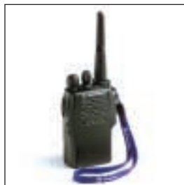
JMZN4020 Pasek do noszenia w dłoni