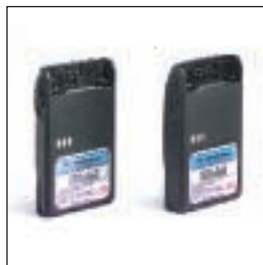
MDJMNN4023/MDJMNN4024 Akumulator Lilon o pojemności 1000 mAh / Akumulator Lilon o pojemności 1320 mAh