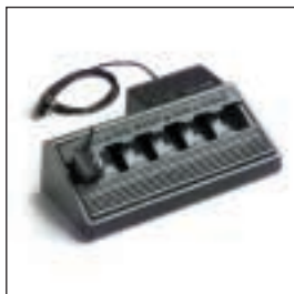
MDHTN3004/MDHTN3005 Ładowarka wielostanowiskowa Z wtyczką europejską / z wtyczką brytyjską